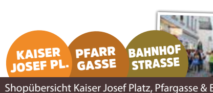
Shopübersicht Kaiser Josef Platz, Pfarrgasse & Bahnhofstraße

BLUMENTRAUM. Ab einem Einkauf von EUR 10,- erhalten Sie ein blumiges Präsent. ROCO 'CO. Das Damenkleidungsgeschäft verwöhnt mit einem Gläschen Sekt. NAME IT & MODUL F. Werdende Mütter erhalten bei jedem Einkauf einen gratis Body für den Nachwuchs. TRACHTEN FEICHTINGER. Bei Kauf eines Dirndls bekommt man eine Dirndlbluse gratis dazu. SCHUH-BERNDORFER. Der Fußspezialist verwöhnt mit Sekt und Knabberleien.