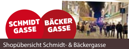
Shopübersicht Schmid- & Bäcker Gasse