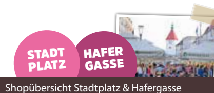
Shopübersicht Stadtplatz & Hafergasse

RUEFA REISEN. Mit vielen netten Gewinnen beim Glücksrad steigt das Urlaubsfeeling für den Sommer. TRIUMPH. Mutter-Tochter-Aktion: ab 2 Sets erhalten Sie einen Sonderrabatt auf das günstigere. QUAND. Dein Quand – Dein Foto – Dein WOW! Du willst jeden zeigen wie du in deinem neuen Outfit aussiehst? Dafür machen wir von dir ein Polaroid. SELENDI. Stöbern Sie mit einem Gläschen Prosecco durch die neuen Trends bei Selendi.